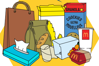
CARTONNETTES ET SACS EN PAPIER