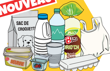
TOUS LES EMBALLAGES PLASTIQUE